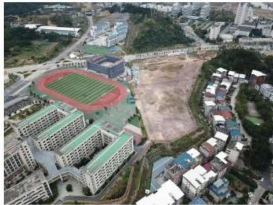
西北侧及周边区域