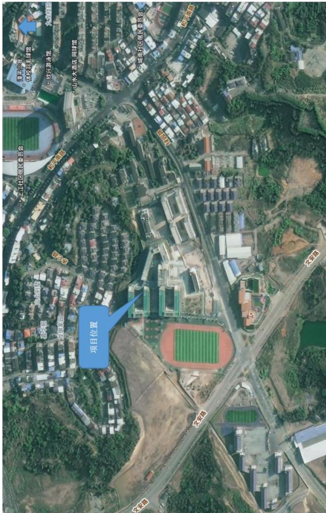
附图 4 项目卫星影像图